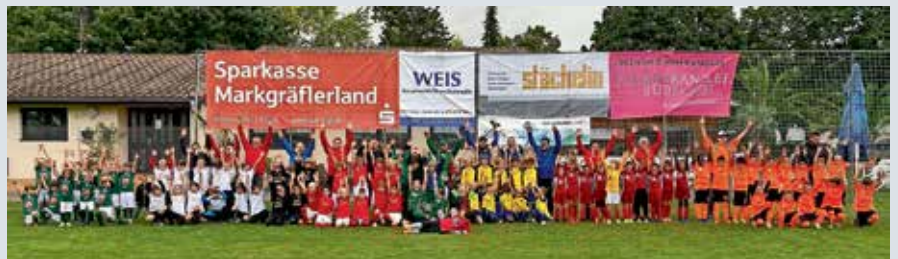
Jugendturnier SFH