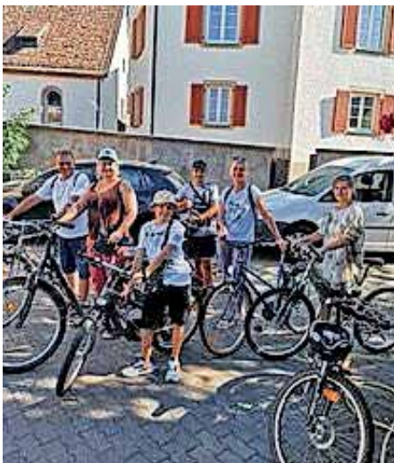
Fahrradwerkstatt Zuflucht e.V.: August 2022

Sollten Sie ein Fahrrad und idealerweise auch Zubehör spenden wollen, bringen Sie dieses bitte zur Fahrradwerkstatt der Zuflucht Müllheim in Hügelsheim, Am Berg 1 (direkt neben der Kirche) am Donnerstag von 14- 18 Uhr.