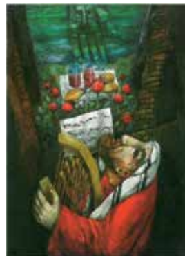
Du deckst mir den Tisch (Ps 23)