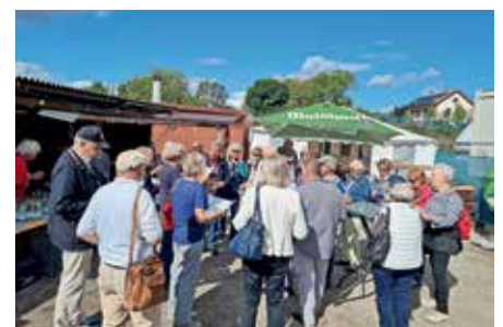
Empfang der Gäste aus Vevey

und Regen gab es nicht. Zur Einstimmung auf die Landesgartenschau gab es eine ausführliche Information in Französisch, so hatten alle eine gute Übersicht und wurden auch zusätzlich begleitet. Um 14.00 Uhr kam man wieder zusammen und bei einem Grillbuffet und abschließend Kaffee und Kuchen saß man beisammen und unterhielt sich. Die Gäste aus Vevey waren begeistert von der Landesgartenschau. Als es dann um 16.30 Uhr galt Abschied zu nehmen, waren die Senioren aus Vevey voll des Dankes für diesen wunderschönen Tag und lobten die Idee mit dem Besuch der Landesgartenschau.